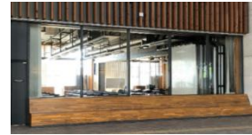
③地球市民交流センター(要予約)