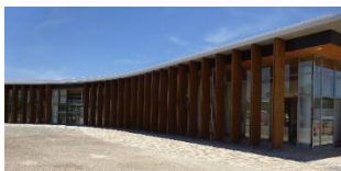
④西口休憩所・案内